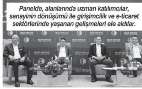
Panelde, alanlarında uzman katılımcılar, sanayinin dönüşümü ile girişimcilik ve e-ticaret sektörlerinde yaşanan gelişmeleri ele aldılar.

Uluslararası Para Fonunun (IMF) Yapay Zeka Hazırlık Endeksi'ne göre, yapay zekanın dünya çapındaki işlerin neredeyse yüzde 40'ını etkileyeceğini anlatan Ardıç, Türkiye'de yapay zeka ekosistemini dünyanın en iyilerinden biri haline